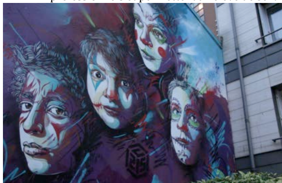
Môm' Pelleport, réseau Môm'Artre